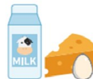
Milk & Cheeses Eggs