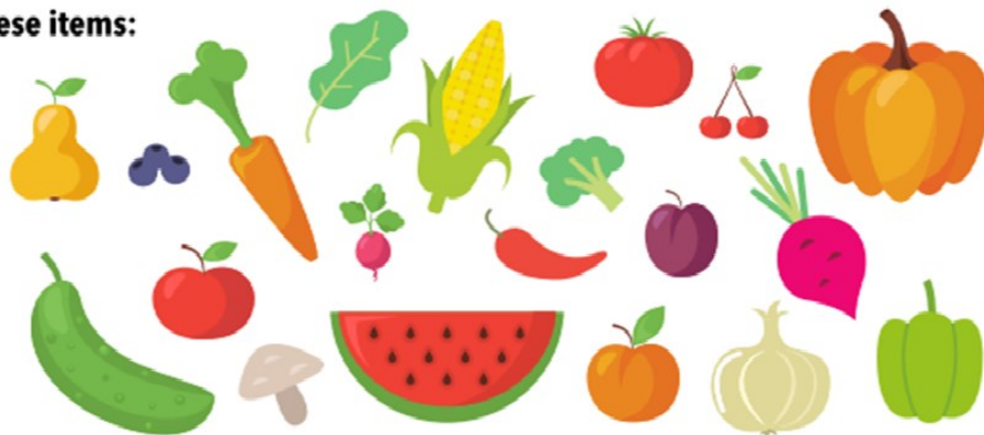
Michigan Grown Fresh Fruits and Vegetables