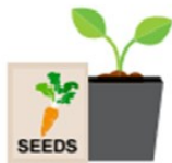
Seeds and plants for food